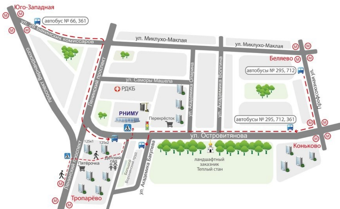
Схема проезда к ФГАОУ ВО РНИМУ имени Н.И. Пирогова

Вход строго по предварительной регистрации! При себе необходимо иметь документ, удостоверяющий личность.